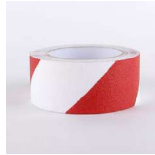
"Nastro adesivo antiscivolo bianco/rosso" 50mmx3m Ref. 852021 50mmx18.3 Ref. 852022 ("Red and white anti-slip adhesive tape ")