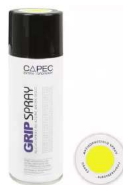
"Spray antiscivolo giallo fosforescente professionale - 400ml"

Ref. 852031 ("Spray antidérapant transparent professionnel StickersLab - 400ml")