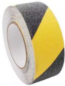
"Nastro adesivo antiscivolo giallo-nero" 50mmx3m Ref. 849442 50mmx18.3 Ref. 849443 ("Black and yellow anti-slip adhesive tape")