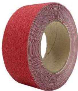
"Nastro adesivo antiscivolo rosso" 25mmx6m Ref. 852069 25mmx18.3 Ref. 852070 ("Red anti-Slip adhesive tape ")