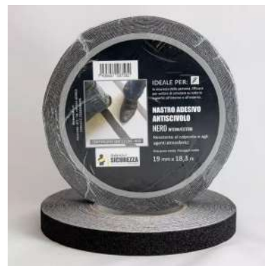
19mmx6m (6 roll) Ref. 850357 19mmx18.3 (1 roll) Ref. 850356 25mmx6m (6 roll) Ref. 850359 25mmx18.3m (1 roll) Ref. 850358 50mmx6m (6 roll) Ref. 850361 50mmx18.3m (1 roll) Ref. 850360 230mmx0.90m (6 roll) Ref. 850362

8 pieds disponibles en deux couleurs : jaune fluo ou vert fluo. 4 pieds droits et 4 pieds gauches. Une excellente solution pour éviter de glisser, idéale pour les chambres d'enfants, les jardins d'enfants, les centres de loisirs ou tout autre endroit où l'on veut éviter les chutes dangereuses. Excellent également comme indicateur d'issue de secours. Idéal également pour l'extérieur. Possibilité de réduction de quantité.