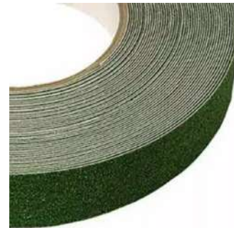
"Nastro adesivo antiscivolo verde" 25mmx6m Ref. 852072 25mmx18.3m Ref. 852071 ("Green anti-slip adhesive tape ")