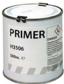
0.5 ml Ref. 851053 1 L Ref. 851054