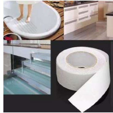
25mmx6m Ref. 852023 25mmx18.3m Ref. 849706 50mmx6m Ref. 852024 50mmx18m Ref. 852025