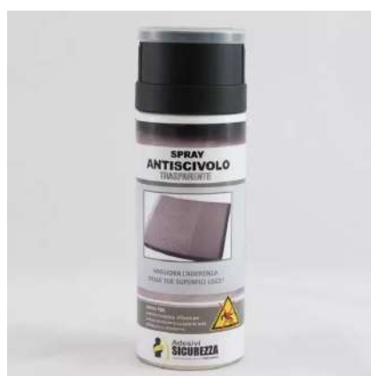
"Spray antiscivolo trasparente professionale StickersLab - 400ml"

Giallo/Gaune Ref. 850417 Blu/Bleu Ref. 850416 ("Spray antidérapant phosphorescent professionnel StickersLab - 400ml")