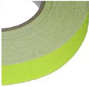
"Nastro adesivo antiscivolo giallo fluo " 25mmx6m Ref. 849440 25mmx18.3m Ref. 849441 ("Fluorescent yellow anti-slip adhesive tape ")