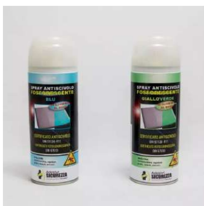
"Spray antiscivolo fosforescente professionale StickersLab - 400ml"

Sprays adaptés aux environnements intérieurs et extérieurs, domestiques et industriels. Ils sont à base de résines acryliques avec des particules antidérapantes, idéales pour augmenter la sécurité des escaliers, des bacs à douche, des sols, des bords de piscine, des balcons, des mains courantes et des surfaces praticables en général. Ils conviennent également pour améliorer l'adhérence sur divers objets et outils. Ils n'abîment pas les surfaces et peuvent être appliqués sur le métal, le plastique, le bois, le marbre, le carrelage, etc. Couverture maximale de 1,5 à 2,5 mètres carrés. En outre, ils sont durables et faciles à appliquer. Ils résistent à l'eau, aux solvants et aux rayons UV et conviennent donc à de multiples situations. Tous nos produits antidérapants sont conformes à la norme DIN 51130 et ont obtenu la meilleure note aux tests antidérapants ( R13 ). Des remises sur les quantités sont possibles.