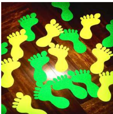
Giallo Fluo/Jaune Fluoréscent Ref. 850484 Verde Fluo/Vert Fluoréscent Ref. 850485