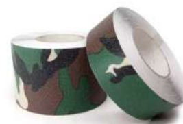
"Nastro adesivo antiscivolo camouflage mimetico" 25mmx6m Ref. 852029 25mmx18.3 Ref. 852027 50mmx6m Ref. 852030 50mmx18.3 Ref. 852028 ("Camouflage anti-slip adhesive tape")